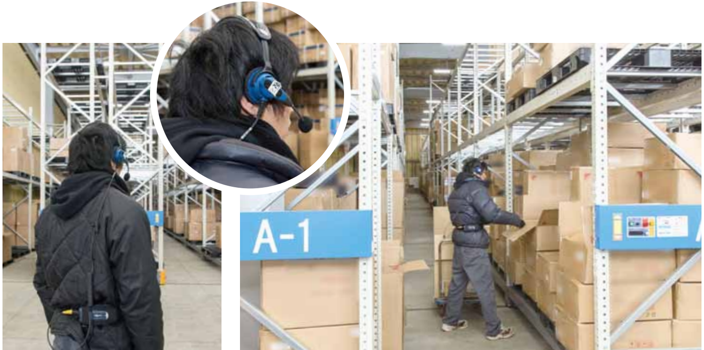
日用品・インテリア用品物流センター(シングルピッキング)