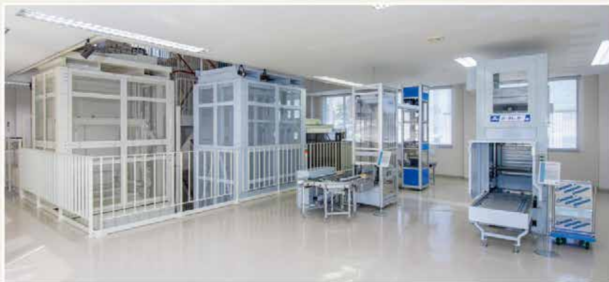
1F展示フロア(天井高2,790mm)