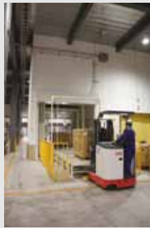
パレット搬送機種

垂直往復搬送機オートレーター（JIS分類名称：垂直往復コンベヤ）は、エレベーターの様にカゴ部（昇降ケージ）を往復（上昇・下降）させることで荷物を運ぶ方式です。多階層の運輸倉庫・物流センター・工場などで導入されており、パレット搬送の場合で、1時間当たり約90パレットの搬送能力があります。また、パレットだけでなく台車や袋物などを同時にフロア状荷受台に載せ込み搬送できるしくみのパレットフリータイプもあります。