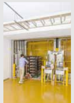
パレットフリー機種 【省スペースタイプ】

※パレットフリーとは、パレットだけでなく、様々な形状の搬送物（台車・袋物）も運べる搬送形態のことです。