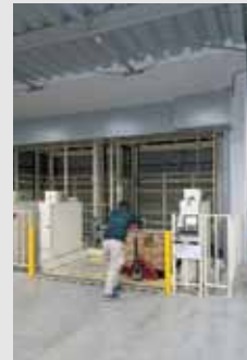
パレットフリー機種 【プールタイプ】