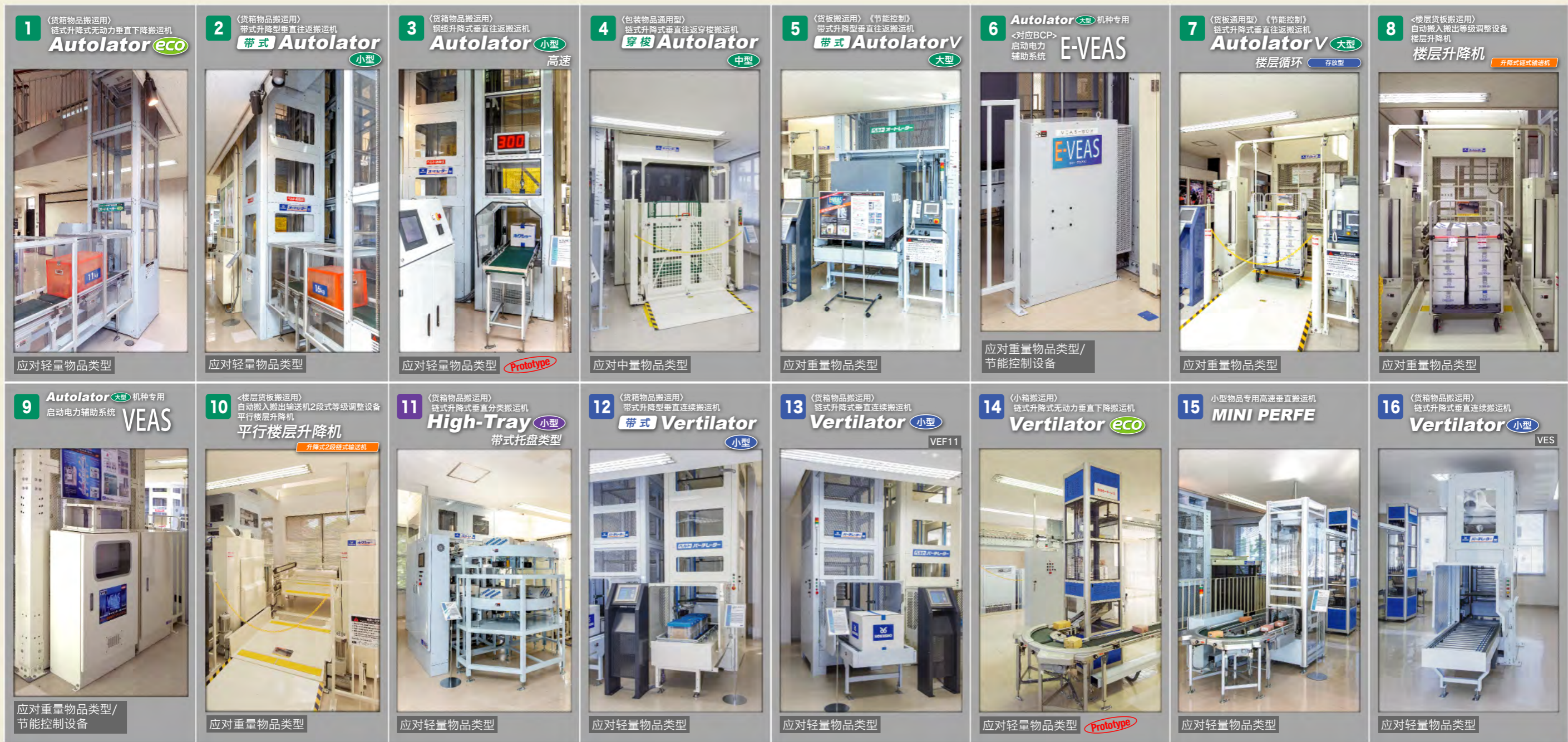
展示机规格一览表