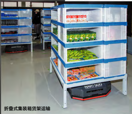
折叠式集装箱货架运输