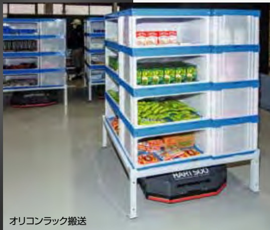
オリコンラック搬送