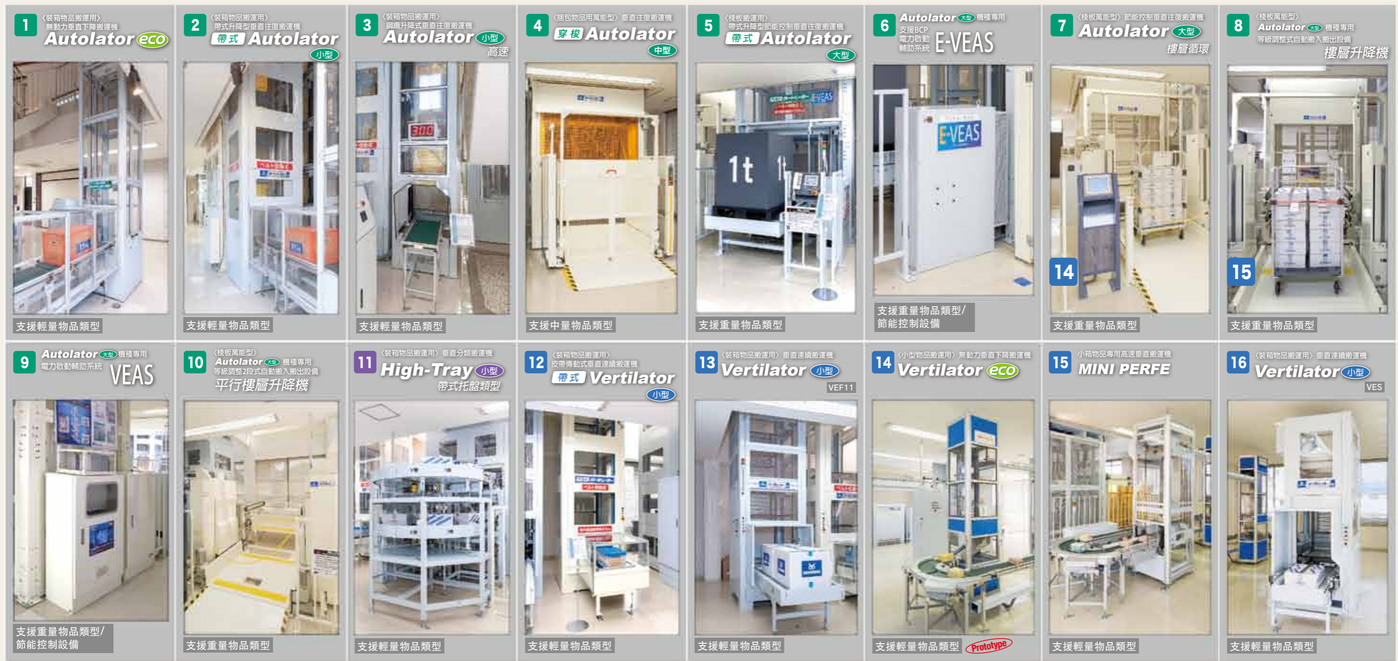
展示機規格一覽表